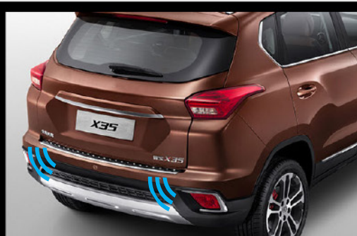
Sensor de retroceso + cámara