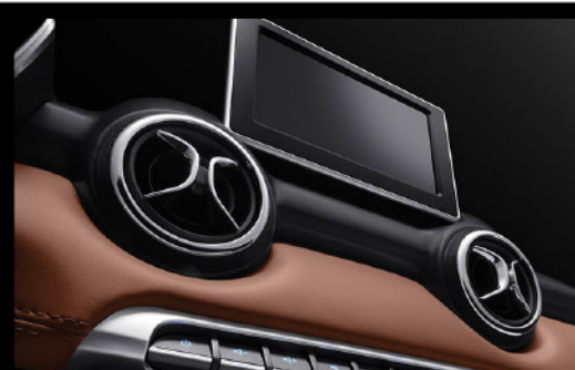
Pantalla táctil 7" + Smart Call