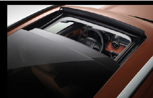
Sunroof panorámico eléctrico